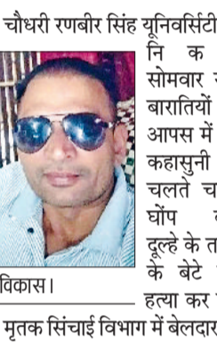
मृतक सिंचाई विभाग में बेलदार के